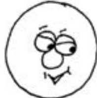
Gặp Rắc Rối